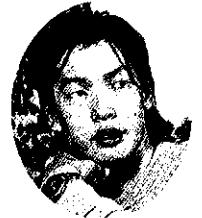
アルタンフヤグ・ドゥガラー