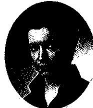
グリゴリー・バリノフ