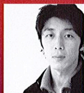
テアトル・ド・バレエカンパニー振付家

14才より越智バレエ団にてバレエを学ぶ。後年、ジャンクロードルイーズ、ジョンクランコ、ノラキッス、ユールゲン・シュナイダーの各氏に師事。69年第1回モスクワ国際バレエコンクールにて銀賞受賞。日本人初のニジンスキー賞を受賞。70年東ベルリンのコミシュオ・オペラのソリストとなる。同年シュトゥットガルト・バレエ団に入団。ミュンヘン国立オペラ・バレエ劇場のエトワールとして契約。80年帰国、フリーに。98年第26回ローザンヌ国際バレエコンクールの審査員を務める。06年ナゴヤ・テアトル・ド・バレエ公演、新作「ダフニスとクロエ」初演。08年平成19年度名古屋市民芸術賞・芸術特賞を受賞。同年橋秋子特別賞を受賞。10年ジャクソン(USA)国際バレエコンクール・ヴァルナ(ブルガリア)国際バレエコンクールの審査員を務める。